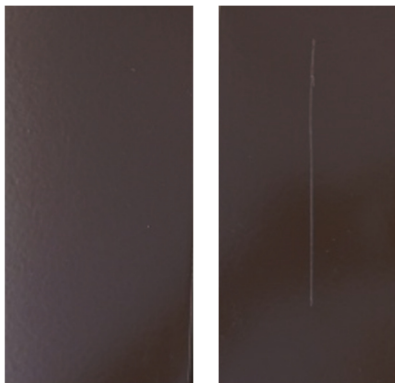
Si 57® EL with and without cut BEFORE testing

The width of the cut has not exceeded 1mm.